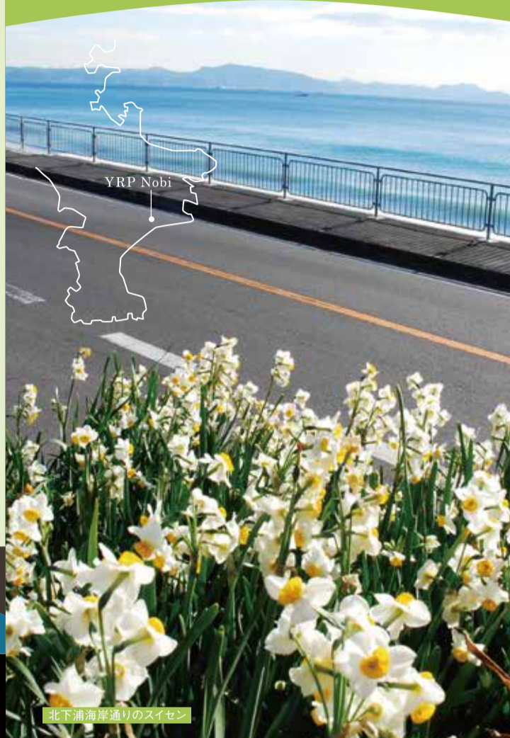
07 YRP Nobi Sta. ~ Keikyu Kurihama Sta.