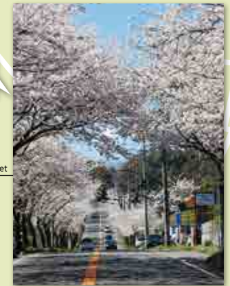
約1.5km350本程の桜のトンネル 350 trees border about 1.5 km