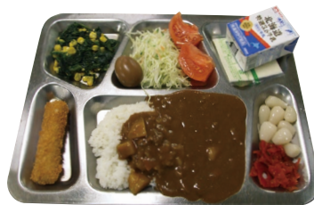
海上自衛隊艦船のカレー

海上自衛隊で提供されるカレーメニューは栄養バランス にすぐれており、ボリュームたっぷり。よこすか海軍カレー 登録店でも、海上自衛隊のカレーレシピを忠実に再現した メニューを提供する店舗もあります。