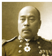
高木兼寛

明治初期に日本海軍で蔓延していた脚気 かっけ の予防法を確立したのは後に海軍軍医総監となる高木兼寛でした。その時に採用されたカレー風味のシチューに小麦粉でとろみをつけたメニューが現在のカレーライスの原型になりました。海軍とともに歩んできた街・横須賀。横須賀はカレー発信の地なのです。